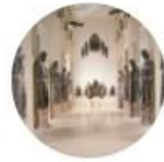
Kulturhistorische Museen und Kunstmuseen (FG)