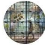
Naturwissenschaftliche Museen (FG)