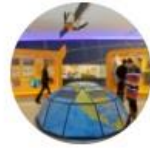
Bildung und Vermittlung (AK)