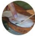
Konservierung / Restaurierung (AK)