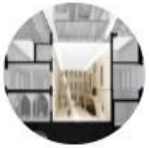
Gebäudemanagement & Sicherheit (AK)