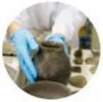
Archäologische Museen (FG)