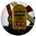
Technikhistorische Museen (FG)