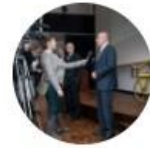
Presse- und Öffentlichkeitsarbeit (AK)